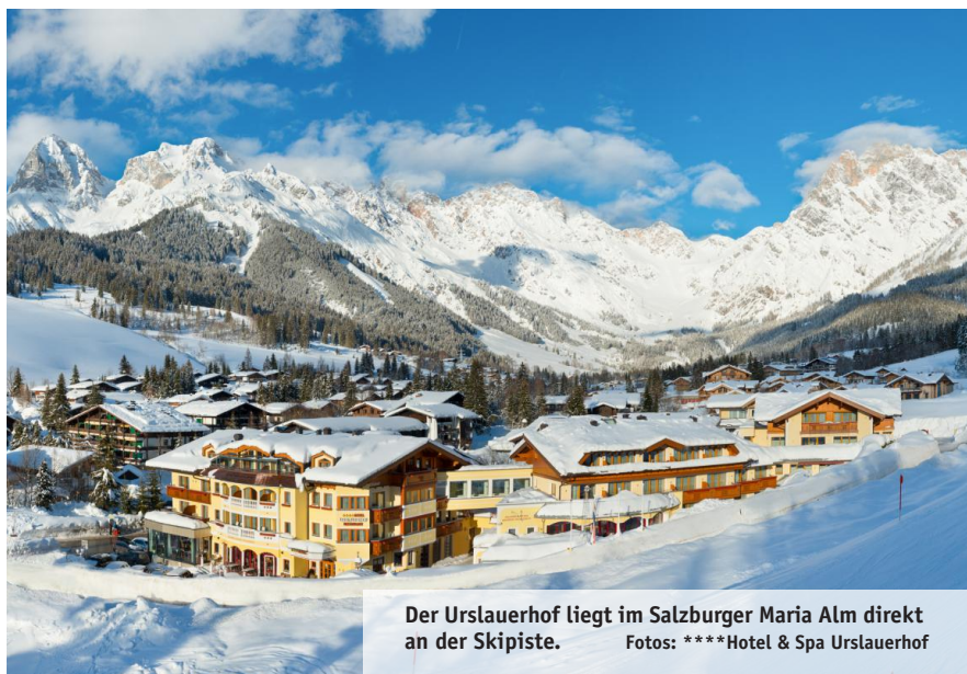
Der Urslauerhof liegt im Salzburger Maria Alm direkt an der Skipiste.