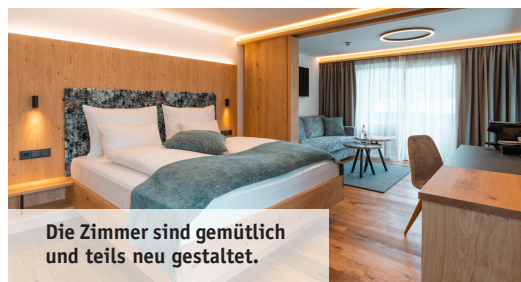
Die Zimmer sind gemütlich und teils neu gestaltet.