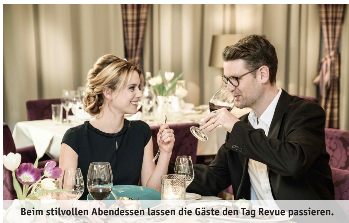
Beim stilvollen Abendessen lassen die Gäste den Tag Revue passieren.

Es gibt Orte, die besucht man – und dann gibt es solche, zu denen kehrt man zurück. Das ****Hotel & Spa Urslauerhof im Salzburger Maria Alm zählt definitiv zur zweiten Kategorie. Denn in diesem Haus fühlt sich jeder Aufenthalt wie ein Wiedersehen an: Der gleiche Tisch am Fenster wie beim letzten Mal, die vertrauten Gesichter des Teams, das sich kaum verändert, das traditionelle Schnapsbankerl, das seit über 20 Jahren an seinem Platz steht: Alles flüstert: Willkommen (zurück).