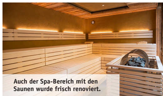
Auch der Spa-Bereich mit den Saunen wurde frisch renoviert.